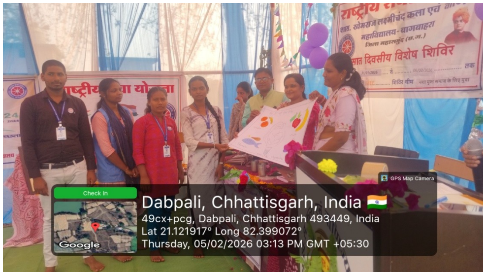
Check In Dabpali, Chhattisgarh, India 🇮🇳 49cx+pcg, Dabpali, Chhattisgarh 493449, India Lat 21.121917° Long 82.399072° Thursday, 05/02/2026 03:13 PM GMT +05:30