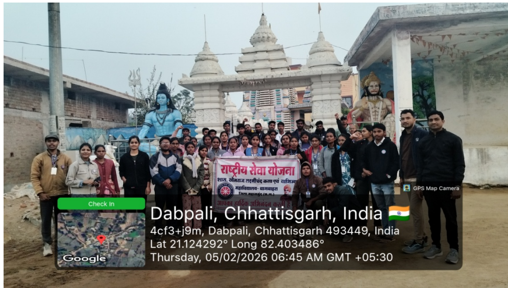
Check In Dabpali, Chhattisgarh, India 🇮🇳 4cf3+j9m, Dabpali, Chhattisgarh 493449, India Lat 21.124292° Long 82.403486° Thursday, 05/02/2026 06:45 AM GMT +05:30