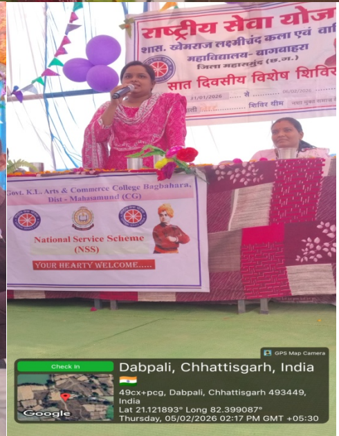
Check In Dabpali, Chhattisgarh, India 🇮🇳 49cx+pcg, Dabpali, Chhattisgarh 493449, India Lat 21.121893° Long 82.399087° Thursday, 05/02/2026 02:17 PM GMT +05:30