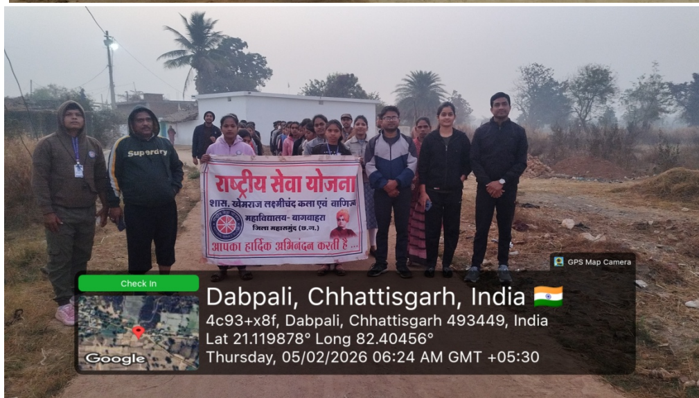
Check In Dabpali, Chhattisgarh, India 🇮🇳 4c93+x8f, Dabpali, Chhattisgarh 493449, India Lat 21.119878° Long 82.40456° Thursday, 05/02/2026 06:24 AM GMT +05:30