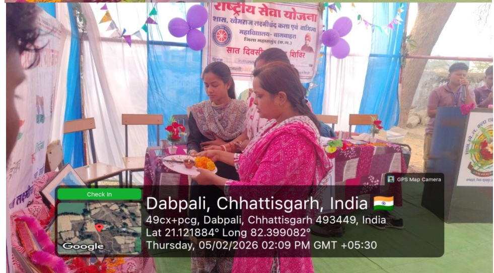
Check In Dabpali, Chhattisgarh, India 🇮🇳 49cx+pcg, Dabpali, Chhattisgarh 493449, India Lat 21.121884° Long 82.399082° Thursday, 05/02/2026 02:09 PM GMT +05:30