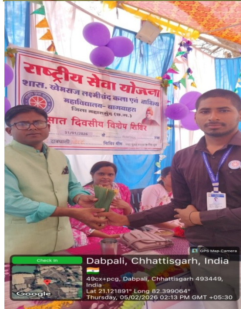
Check In Dabpali, Chhattisgarh, India 🇮🇳 49cx+pcg, Dabpali, Chhattisgarh 493449, India Lat 21.121891° Long 82.399064° Thursday, 05/02/2026 02:13 PM GMT +05:30