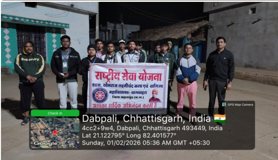
द्वितीय दिवस प्रभात फेरी