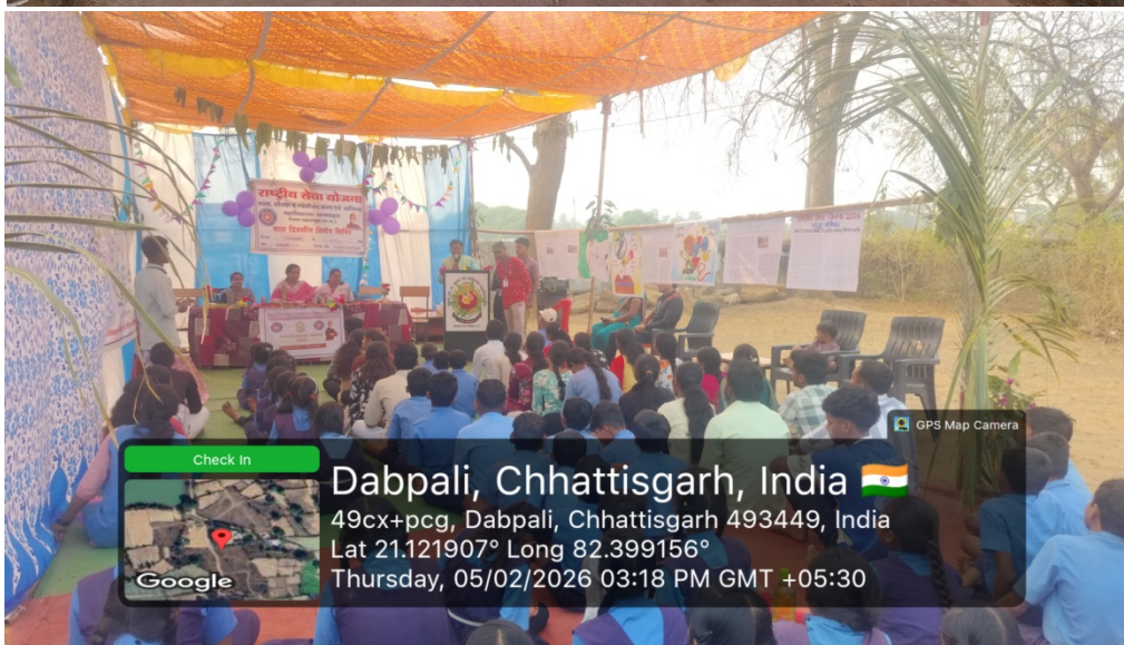
Check In Dabpali, Chhattisgarh, India 🇮🇳 49cx+pcg, Dabpali, Chhattisgarh 493449, India Lat 21.121907° Long 82.399156° Thursday, 05/02/2026 03:18 PM GMT +05:30